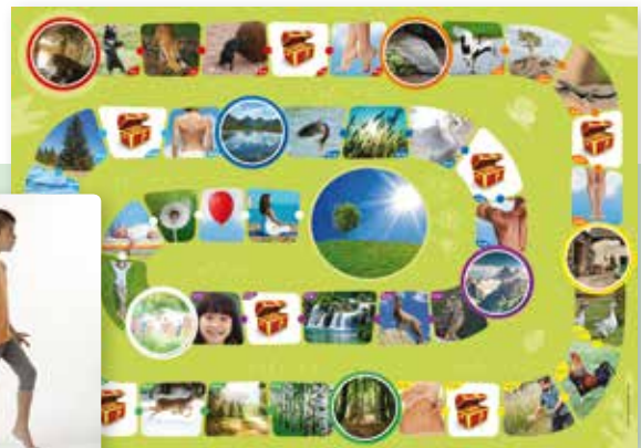
Spelbord met 70 activiteiten