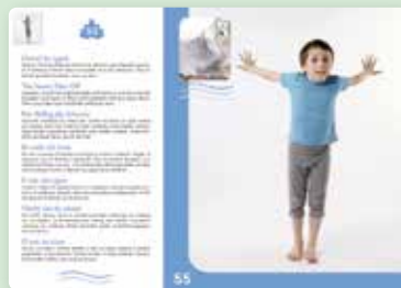
Met pedagogische handleiding (NL)