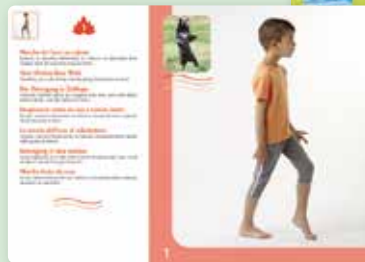
35 dubbelzijdige instructiekaarten