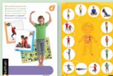
1 poster met 14 oefeningen rond ademhaling