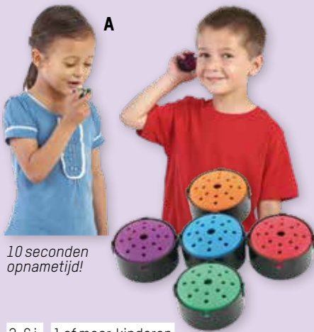
10 seconden opnametijd!