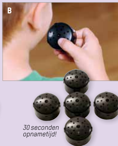
30 seconden opnametijd!