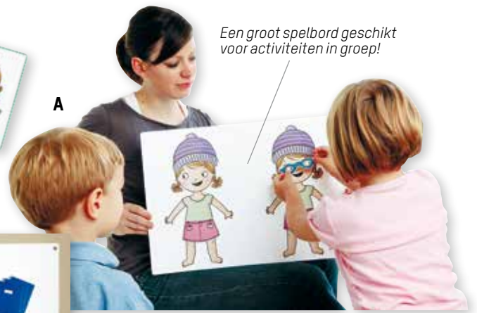
Een groot spelbord geschikt voor activiteiten in groep!