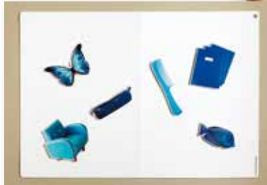
1 blanco bord om te sorteren