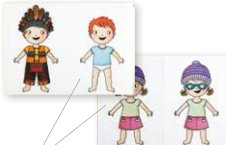
2 grote platen met figuurtjes om aan te kleden en te bespreken