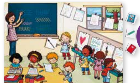
3 prentkaarten met dagelijkse situaties