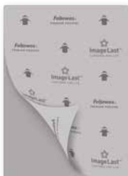
Imagelast = Lamineerrichting is aangegeven op de folie en verdwijnt na het lamineren.